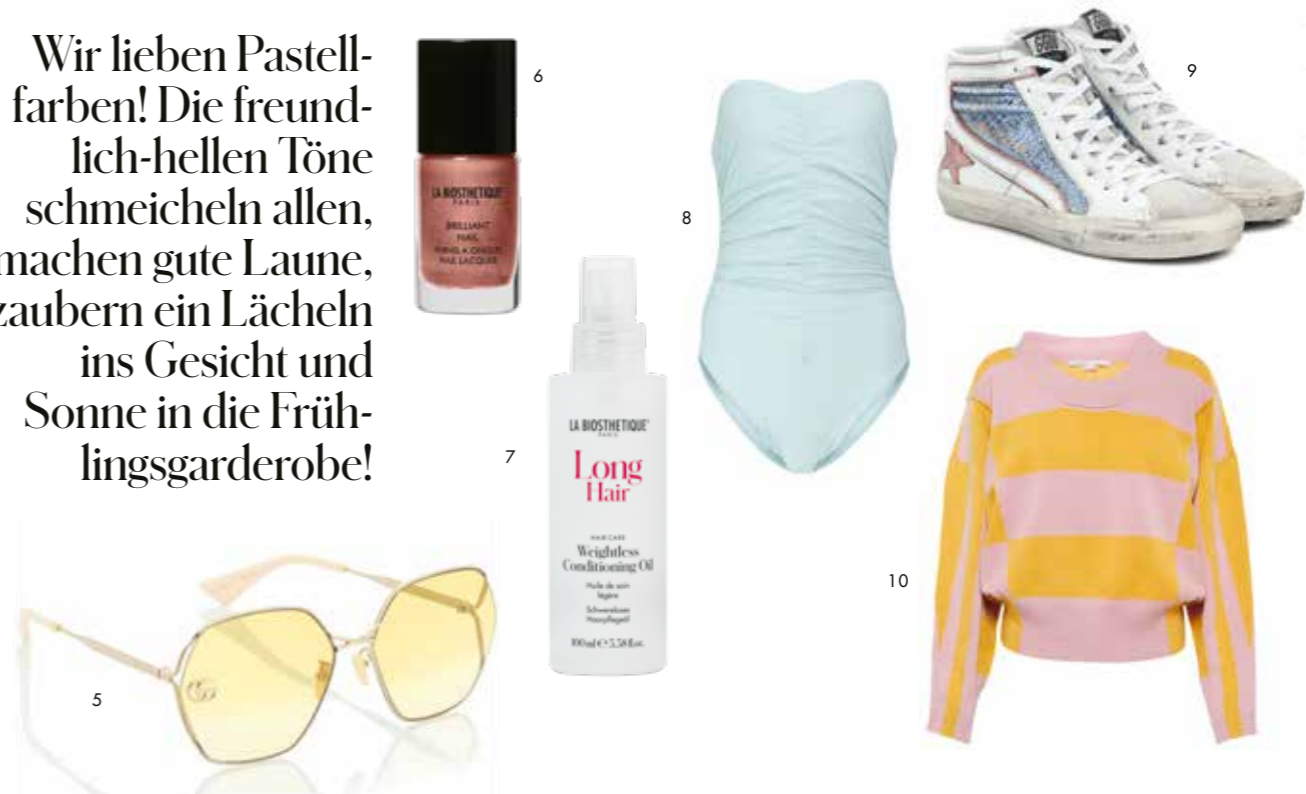
1. Stiletto-Stiefel mit Krokoprägung von PARIS TEXAS bei farfetch.com . 2. Kurze Denimjacke von ISABEL MARANT ETOILE bei matchesfashion.com . 3. Luxuriöses Puder-Rouge Tender Blush Passion Rose von LA BIOSTHETIQUE . 4. Schultertasche Le Cagole aus Metallic-Leder von BALENCIAGA . 5. Sonnenbrille mit Verlaufsstönung von GUCCI . 6. Lange haftender Hochglanz-Nagellack Brilliant Nail Rusty Rose von LA BIOSTHETIQUE . 7. Federleichtes Haarpflegeöl für glänzend glatte Längen von LA BIOSTHETIQUE . 8. Bandeau-Badeanzug mit seitlichen Raffungen von KARLA COLLETTA . 9. Halbhohe Sneakers mit Metallic-Einsätzen von GOLDEN GOOSE . 10. Blockstreifen-Pullover von STELLA MCCARTNEY bei mytheresa.com .

Wir lieben Pastellfarben! Die freundlich-hellen Töne schmeicheln allen, machen gute Laune, zaubern ein Lächeln ins Gesicht und Sonne in die Frühlingsgarderobe!