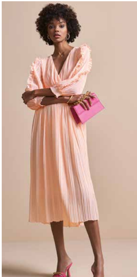
4 SALON BEAUTE

Pastelltöne sind tolle Kombipartner, die mit anderen Farben und untereinander perfekt harmonieren.