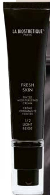
FRESH SKIN 1 / 2 LIGHT BEIGE