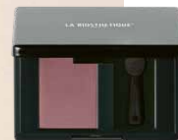
MAGIC SHADOW 50 SMOOTH PINK

Für glänzend glatte Looks: Heat Protector für Hitzeschutz beim Thermostyling.