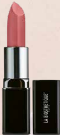
SENSUAL LIPSTICK B240 PEONY BLOSSOM